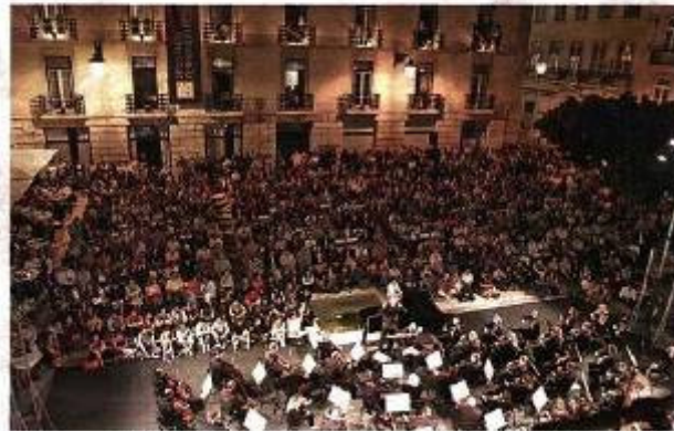
Organizadores esperam atingir uma média de mil espectadores por cada evento

Lisboa. Sob a égide do Opart, entidade que gere São Carlos e CNB, o Festival ao Largo realiza-se de 26 de Junho a 19 de Julho, no Largo de São Carlos. Músicas, bailado e teatro, em 18 espectáculos de entrada livre, sempre às 22.00